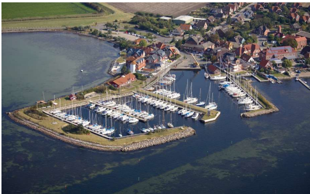
Abbildung 1 / Lemkenhafen einer der schönsten Häfen an der Ostsee

E-Mail : ostsee@if-boot.de Tel. : +49 171 6223251 IF-Boot : Muffe Segel-Nr. : GER 1788 Rufzeichen: DJ7673